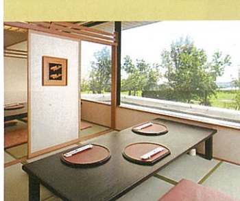
少人数の方にゆったりご利用いただける個室