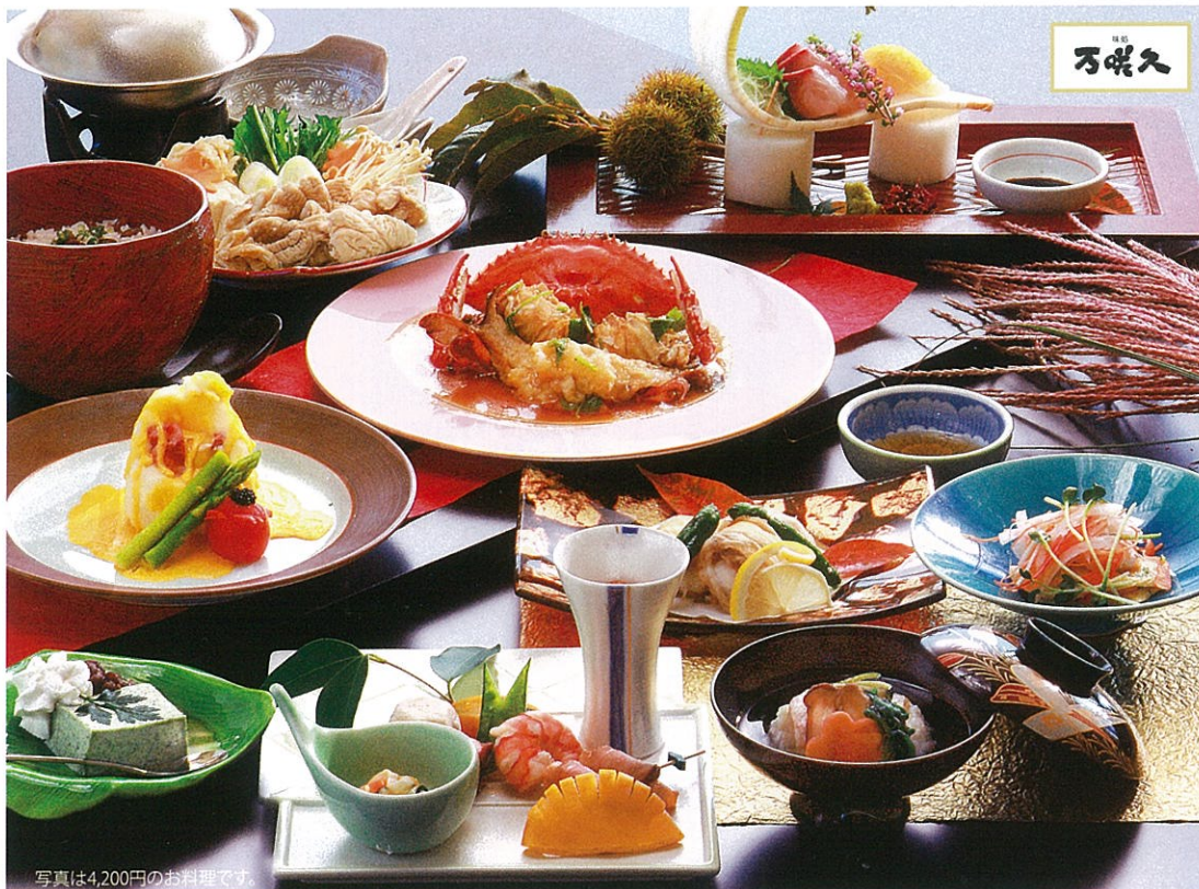
写真は4,200円のお料理です。

特別プラン [旬味いろいろリッチな女性の集い会席]¥3,980が前売券¥3,480でご利用いただけます。