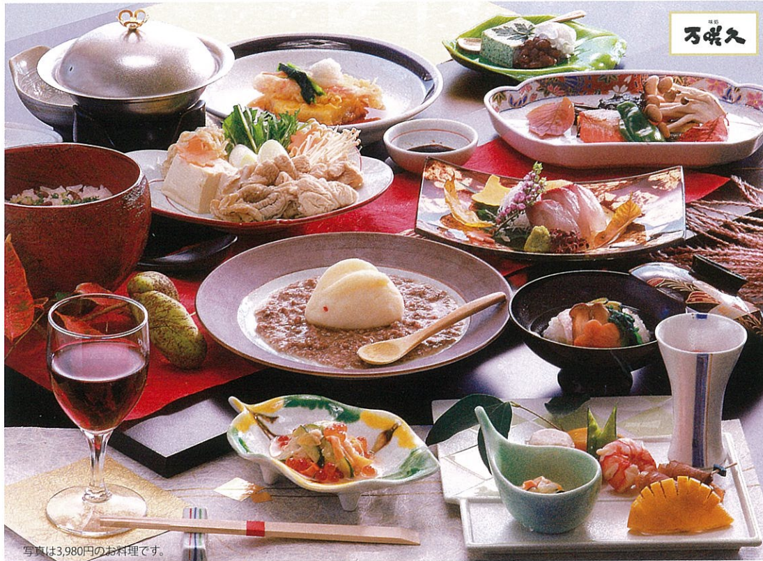
写真は3,980円のお料理です。

色鮮やかに彩られた逸品は旬が香る日本の和の美味佳肴。地場の特産や海山の食材をふんだんに取り入れた冬の風情あふれる会席料理はファミリー、女性の集いをにぎやかに彩ります。