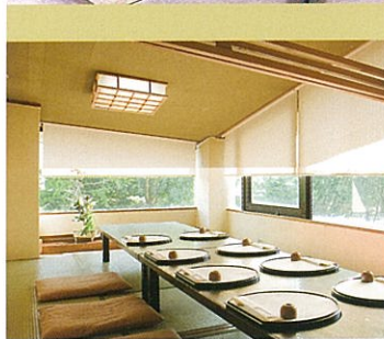
グループの集いにプライベートな和風個室