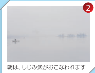
朝は、しじみ漁がおこなわれます