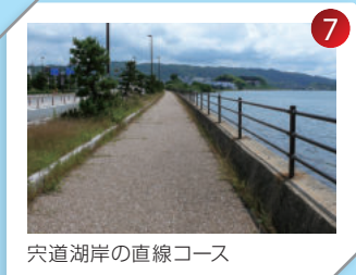
穴道湖岸の直線コース