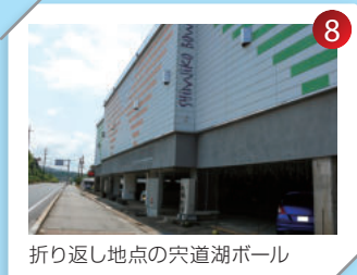
折り返し地点の穴道湖ホール