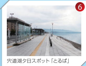
穴道湖夕日スポット「とるば」