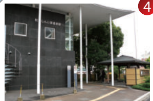
足湯有・一畑電鉄松江しんじ湖温泉駅