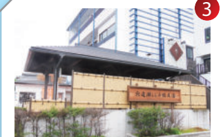
穴道湖しじみ館の足湯