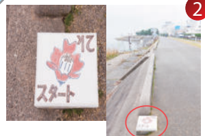
ランニングコースのスタート地点にある陶板