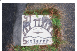
折返し地点の陶板