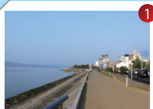
穴道湖沿いのコース